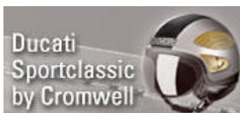
Ducati Sportclassic by Cromwell