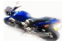
HONDA 11000 X11 (4900 €)