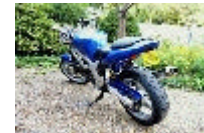
SUZUKI 650 svn (4400 €)