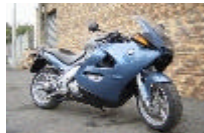
BMW 1200 K1200RS (6400 €)