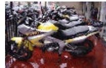
YAMAHA 125 TDR (2450 €)