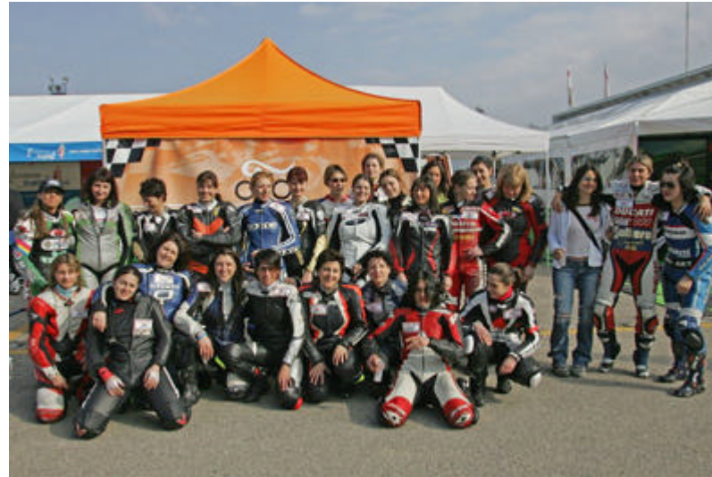
Eccole, in gruppo, le protagoniste del Campionato Italiano Motocicliste 2006

tutto il gruppo a crescere a vista d'occhio, con miglioramenti che vanno dai 2 fino anche ai 7 secondi, rispetto alla gara del 2005. Un grande aiuto proviene anche dalle nuove gomme montate per il trofeo, le nuove Dunlop GP Racer ora proposte in due mescole (una media e una più morbida) e due misure per il posteriore (180 e 190).