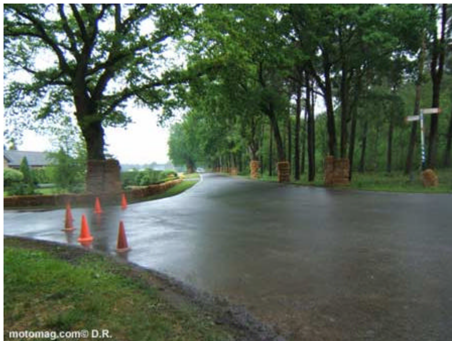
Route boisée, paysage verdoyant : un cadre idyllique pour une balade. Un peu moins engageant pour abattre des chronos, surtout sur le mouillé.