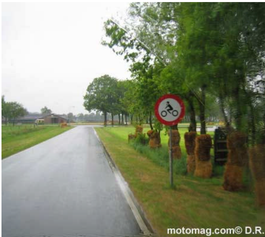
Poteaux, arbres, maisons. Côté danger, rien ne manque sur le bord de la « piste » de Hengelo. Le Tourist Trophy en pire : courir au TT est un choix, mais cette route a été imposée comme circuit aux participantes de l'EWG.