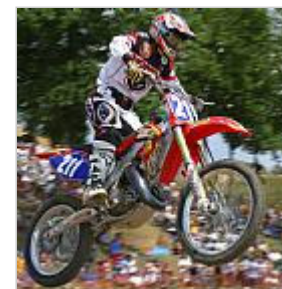
Stefy Bau, una delle più forti crossiste sulla scena internazionale. La sua carriera è stata interrotta da un grave infortunio al piede