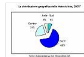
La distribuzione geografica