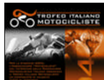
Trofeo Motocicliste - A Misano tutto pronto per la prima prova del 2005