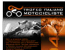
Trofeo Motocicliste - Resoconto 2.a Prova a Varano De Melegari