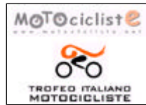
Raduno Motocicliste - Donne e Motori all'attacco di Varano

5° MEETING EUROPEO MOTOCICLISTE 30-31 luglio 2005 Autodromo di Varano de' Melegari (Parma) organizzato da MOTOCICLISTE.NET col patrocinio della FEDERAZIONE MOTOCICLISTICA ITALIANA