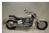
YAMAHA 650 DRAGSTAR (6612 €)