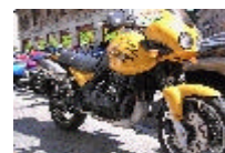
TRIUMPH 900 TIGER (4600 €)