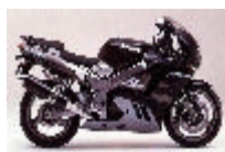
KAWASAKI 900 Zx9r (3900 €)