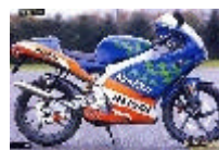
APRILIA 50 RS (2000 €)